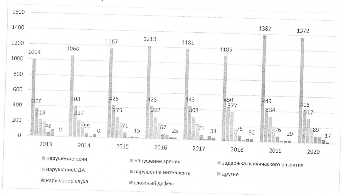
Численность воспитанников с ОВЗ в группах компенсирующей направленности

1.5.3. В 2020 году в дошкольных образовательных организациях численность воспитанников с ОВЗ в группах компенсирующей направленности составила 2 595 человек (в 2019 году – 2 567 детей).