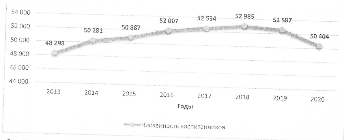
Рис. Численность воспитанников образовательных организаций, осуществляющих образовательную деятельность по образовательным программам дошкольного образования, в чел.

1.1.1. Мероприятия по созданию дополнительных мест для дошкольников позволили реализовать Указ Президента Российской Федерации от 07.05.2018 № 204 «О национальных целях и стратегических задачах развития Российской Федерации на период до 2024 года» в части обеспечения доступности дошкольного образования для детей в возрасте от 3 до 7 лет. Доступность дошкольного образования в Ивановской области уже в 2014 году составила 100% и в 2020 году сохранилась на этом же уровне.