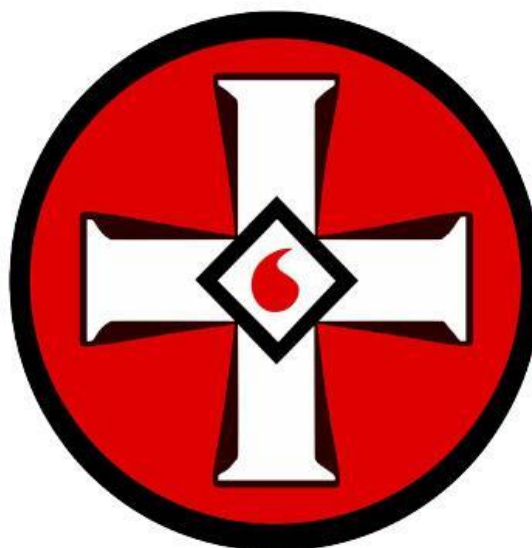
Рисунок 1. Эмблема ультраправой организации «Ку-клукс-клан»