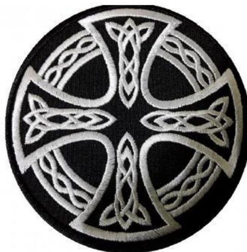
Рисунок 2. Кельтский крест. Символ многих расистских организаций