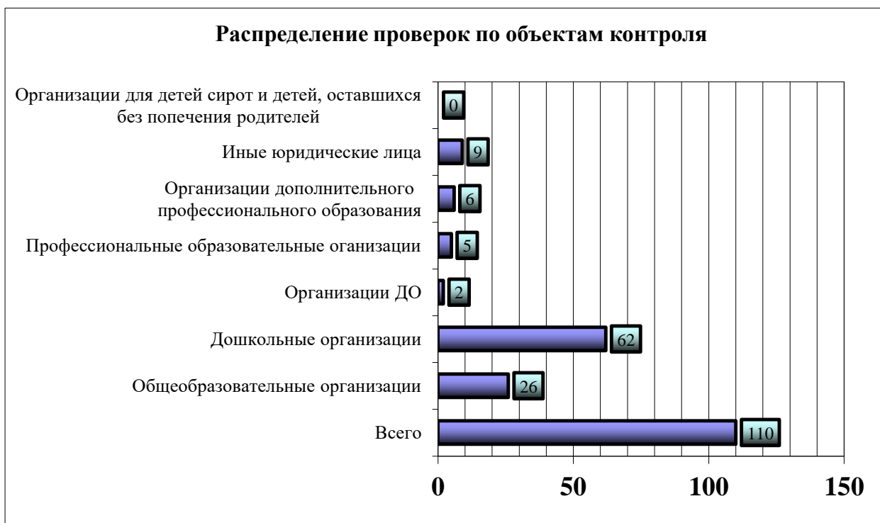
Таблица № 1